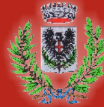
Comune di Laigueglia

Il presente programma è stato elaborato con la collaborazione di: